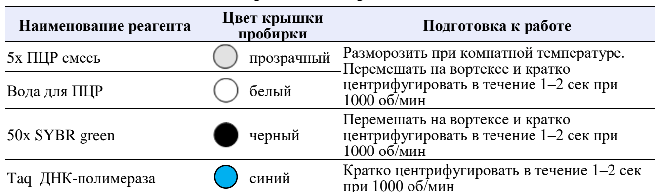
Таблица 8. Подготовка реагентов к работе

Не использовать вортекс для Тaq ДНК-полимеразы, это может привести к инактивации.