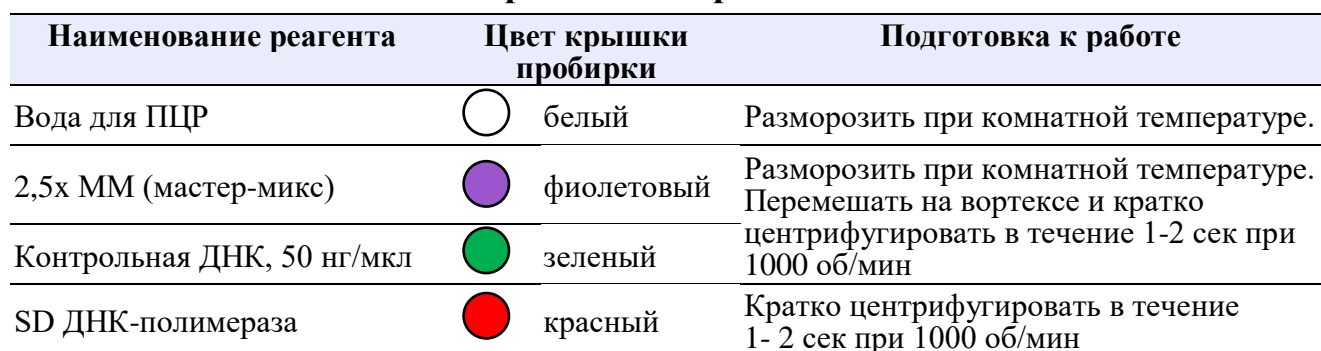
Таблица 5. Подготовка реагентов к работе

Не использовать вортекс для SD ДНК-полимеразы, это может привести к инактивации фермента.