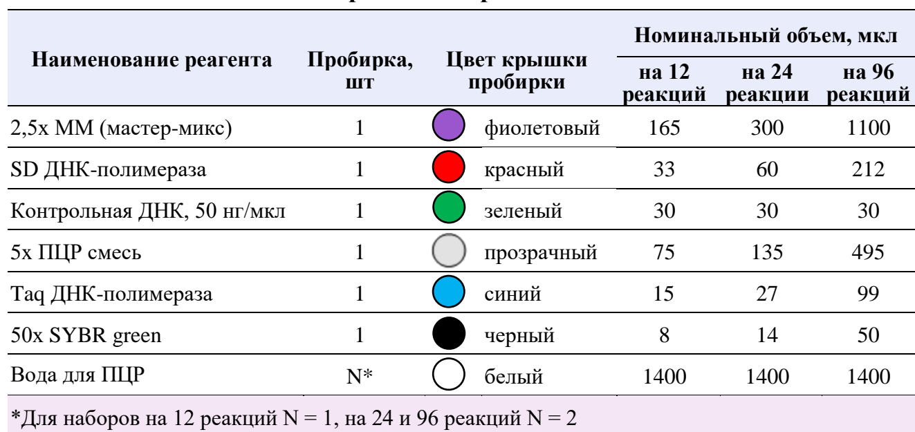
Таблица 1. Состав набора и объем реагентов

Состав набора и объем реагентов приведены в таблице 1.